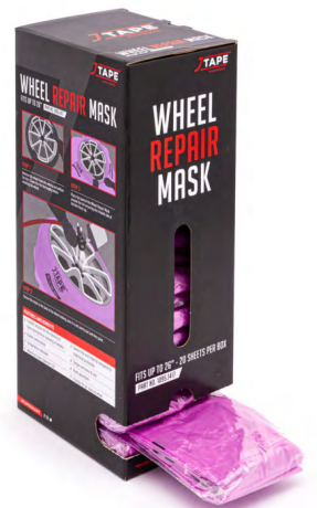
※1ケース（20枚入）梱包写真