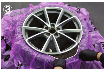
③ シートの Paint This Side の文字が 上側になるようにゴムバンドをリム に巻き付けて下さい