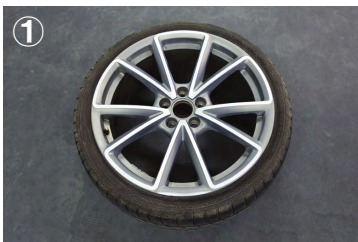
① 車両からホイールを取り外し、 タイヤの空気を抜いて下さい