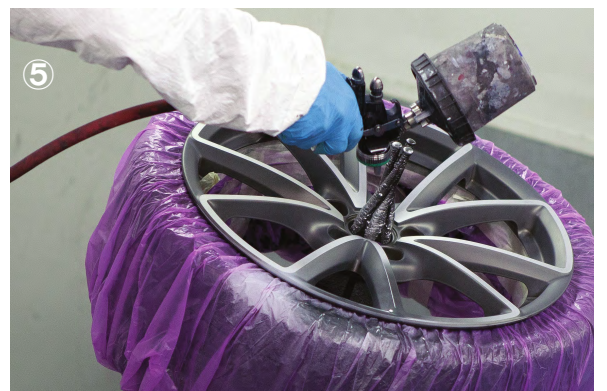
⑤ シートをテープで固定したら、タイヤを元の表側に裏返し、 ゴムバンドが確実に密閉されているかを確認してから塗装 を開始して下さい

材質 : 中密度ポリエステル 色 : パープル 厚さ : 20 ミクロン (0.02 mm) サイズ : 170×170 cm