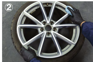
② インナーリムの汚れやグリース（油脂）をキレイに取り除いて下さい