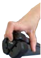
クイックリリース機能