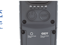
新機能 CCT スキャン