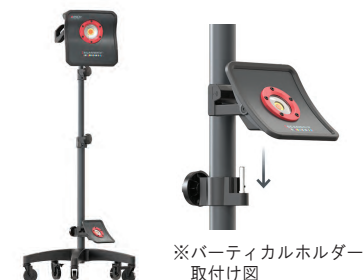
※バーティカルホルダー取付け図