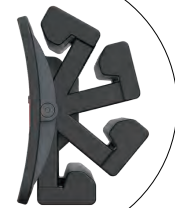
160° 回転グリップホルダー