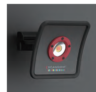
強力マグネット付きにより壁や柱につけても利用可能