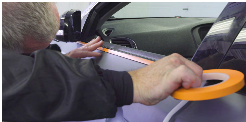
ストレートラインの見切りにくつきりキレイに貼れる