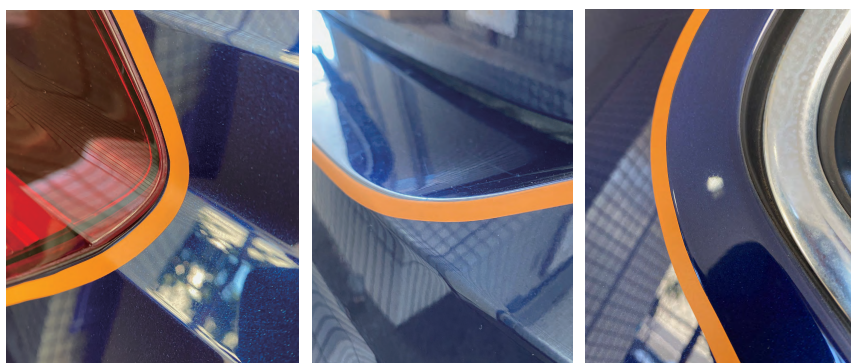
様々なカーブにも対応、粘着性もバッチリ